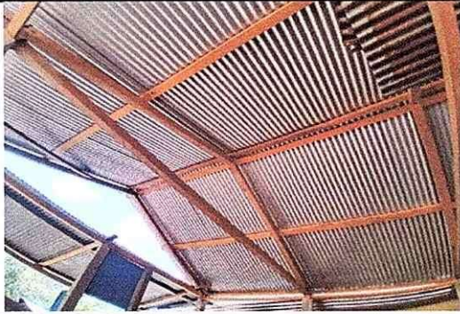
Foto1: cambio de costaneras de madera a metal